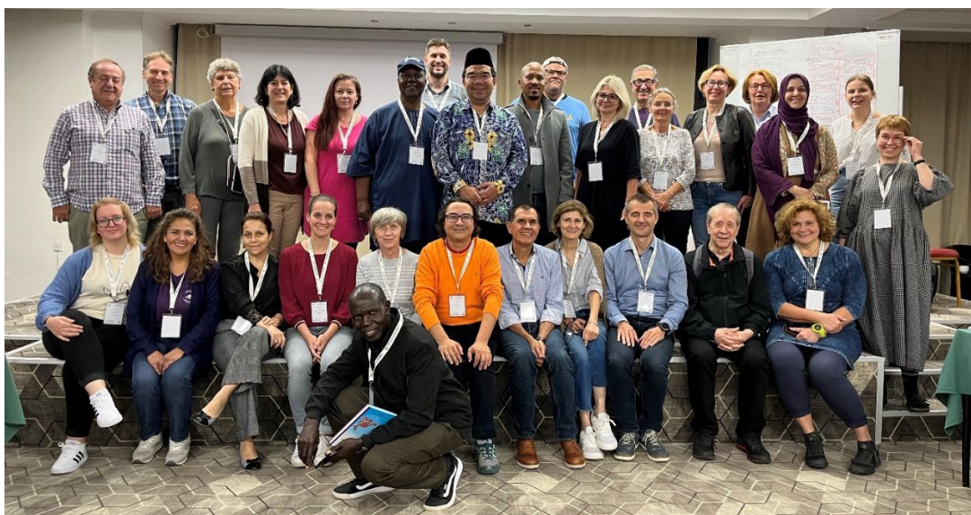
Groupe Benjamin, catégorie H7/H8