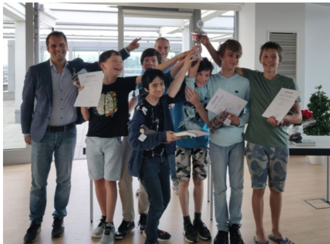
Notre équipe victorieuse lors de la remise du trophée

Ce concours est très apprécié des jeunes, il a eu lieu pour la 15e fois cette année ! Un classement par équipe est également établi et, cette année, l'équipe suisse a remporté la coupe pour la première fois !